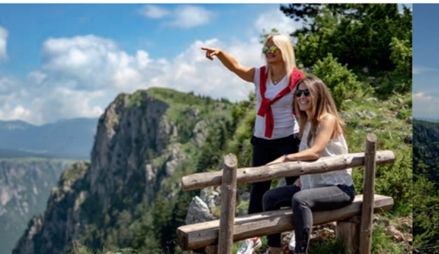
Planinarska staza za Ćurevac