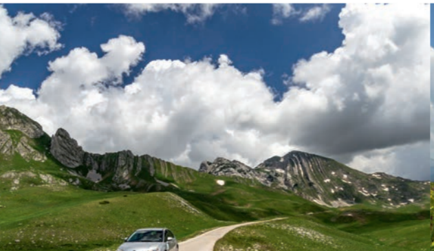
Todorov do i Prutaš (2.393 mnv)