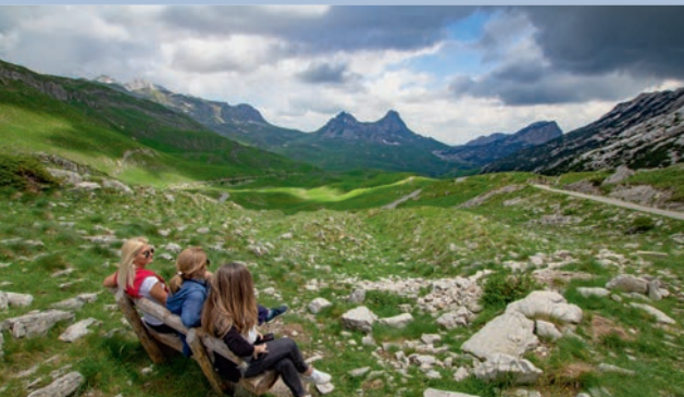
Pogled na Sedlo

Posljednji dio rute ide magistralom od Šavnika ka Žabljaku i ponovo nudi pogled na panoramu durmitorskog masiva, sa Savinim kukom (2.313 mnv) u centru pažnje, prije nego što se ruta završi u centru Žabljaka.