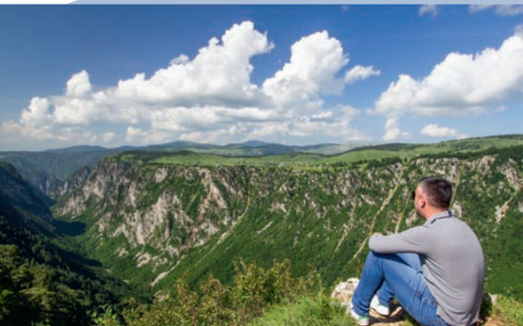
Kod Nedajnog: Pogled na kanjon Đorđa