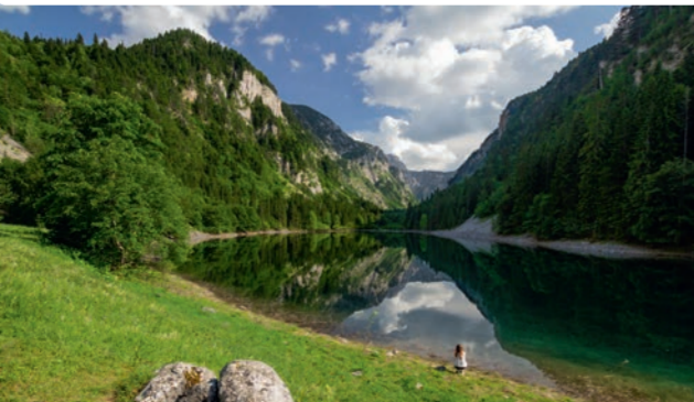
Na Sušičkom jezeru