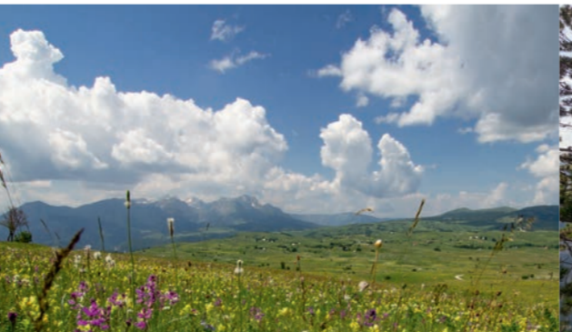
Visoravan kod Pišča - u pozadini: Bioč i Maglič