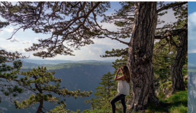
Kanjon Sušice kod Male Crne Gore